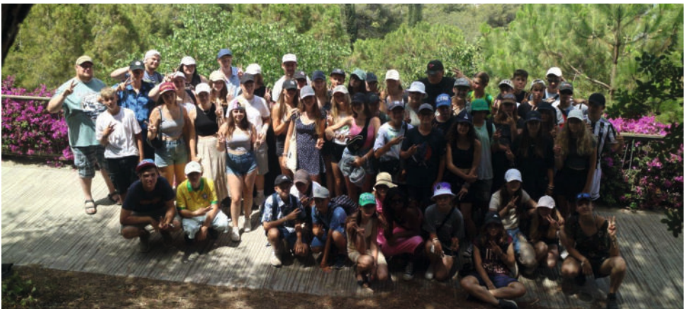
Sommerabenteuer mit einzigartigen, unvergesslichen Erlebnissen

und so beschäftigten wir uns gerade in der Mittagshitze im Schatten häufig mit dem Spiel „Werwölfe“. Es gab aber auch immer mal kleine Angebote - von Henna Tattoos bis Armbänder knüpfen. Ebenso kam die Zeit im Wasser nie zu kurz. Jeden Nachmittag hatten wir die Möglichkeit, uns im Meer oder Pool abzukühlen und nahmen das Angebot gerne an. An einigen Tagen gab es auch die Möglichkeit, Stand-Up-Paddle-Boards zu nutzen und in einer geführten Tour den Fluss Fluvia zu erkunden, wo wir mit etwas Glück sogar die springenden Fische sahen. Dabei amüsierten wir uns auch alle sehr über unsere anfangs sehr wackeligen Versuche, auf den Boards zu stehen. Doch rasch hatten wir den Dreh raus und so sprangen wir auch zwischendurch zur Abkühlung mit einer gekonnten „Arschbombe“ in das kühle Nass. Auch unsere Mountainbike-Tour, mit