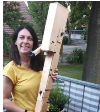
Erwerb einer Subbassflöte

Informationen zum Verein sind auch auf der Homepage der Kirchengemeinde zu finden.